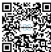
布鲁克磁共振微信公众号